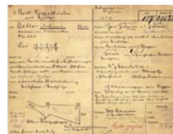
ORIGINAL GEWEHRKARTE DES MAHARADSCHAS VON BIJAWAR ORIGINAL GUNCARD OF THE MAHARADSCHA OF BIJAWAR