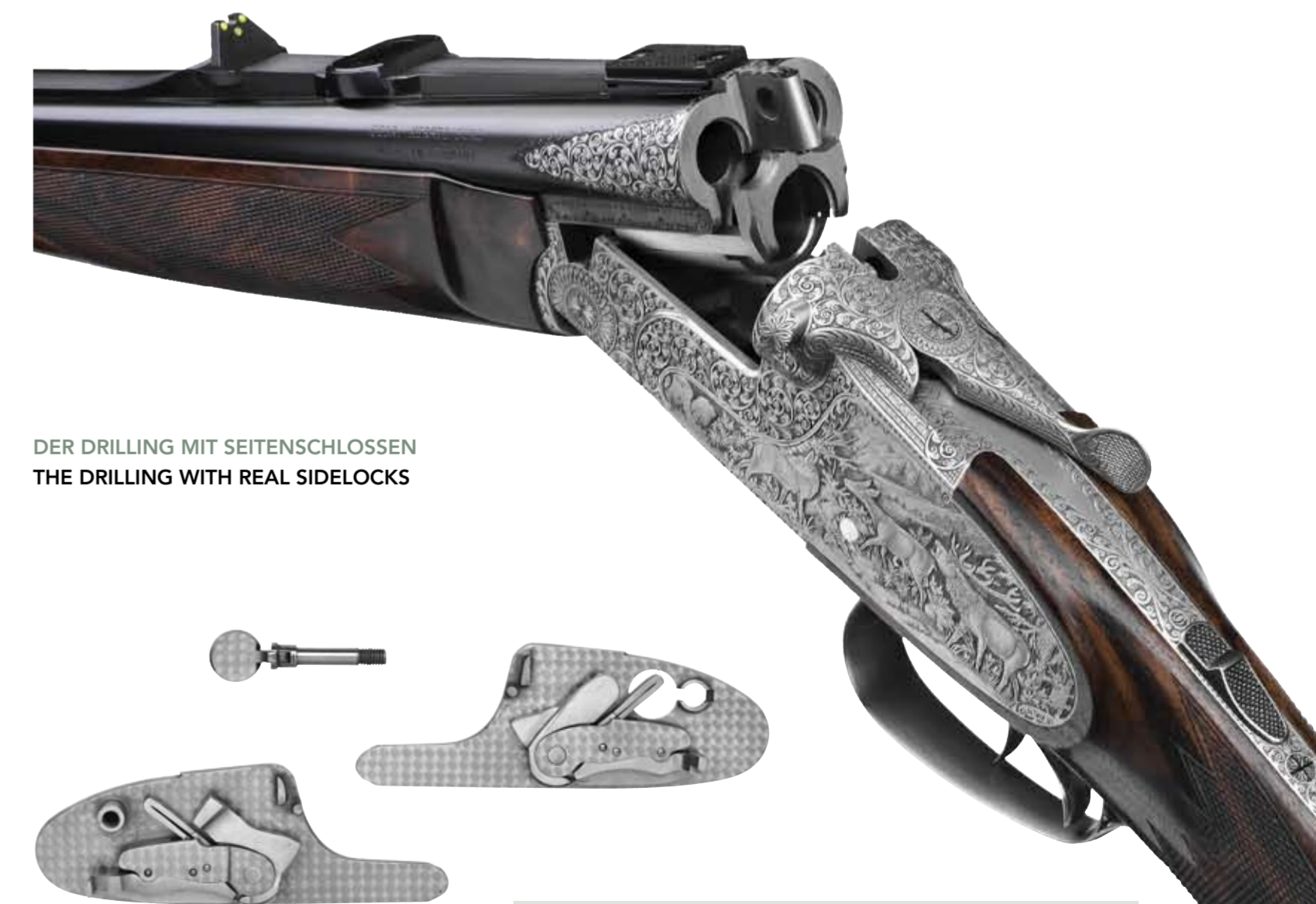
DER DRILLING MIT SEITENSCHLOSSEN THE DRILLING WITH REAL SIDELOCKS

EXPRESS DRILLING 9615: Agil, slim and jet more noble: Following the presentation of the light and slim “Blitzlock“-drilling family in the Meisterstück category last year, the Suhler factory now presents the luxury version of this drilling. Absolutely new are the intrinsic values: after opening the finely engraved side-plates with the concealed lever you see what is behind the facade – real side-locks. These fine mechanical parts get their power from V-springs. The steel surface is finished with that what the Suhler gunsmiths call a typical „Zella Mehli finish“, a special polish. The weight of the new Merkel sidelock express drilling is app. 3,4 kg. Rifle calibers are 8x57IRS and 9,3x74R. The shotgun barrel has 12/76 with a ½ choke (steel shot proofed).