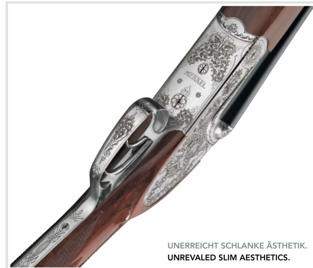
UNERREICHT SCHLANKE ÄSTHETIK. UNREVEALED SLIM AESTHETICS.