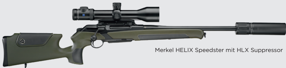
Merkel HELIX Speedster mit HLX Suppressor